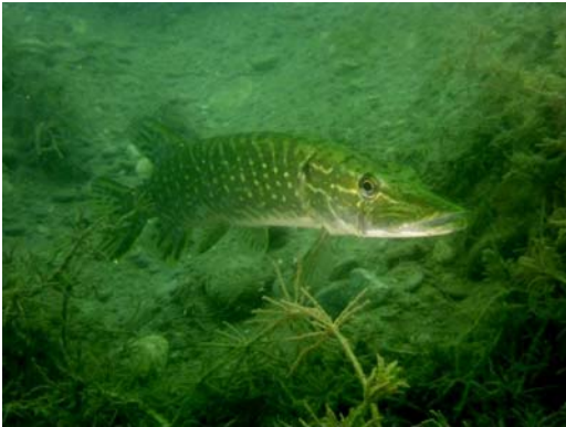
Pike - Brochet