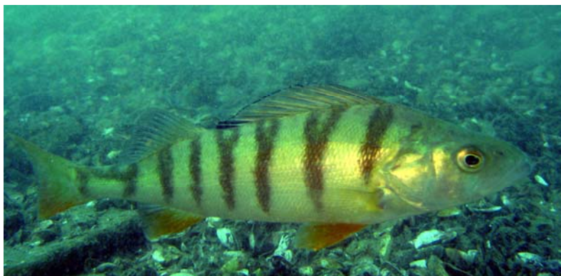
Perch - perche

Imagine yourself floating in front of a steep cliff, watching the corners as if you were floating in front of a 20-storey building and you look inside and watch the many original decorations. Sometimes you come across an inhabitant waving his barb like our fresh-water tiger, our dear burbot certainly named because of its great voracity and stripes of its skin. Its color can vary but those of our Riviera are an olive yellow interspersed with irregular blotches of brown-black.