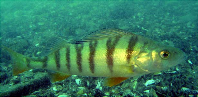
Perche - Perch