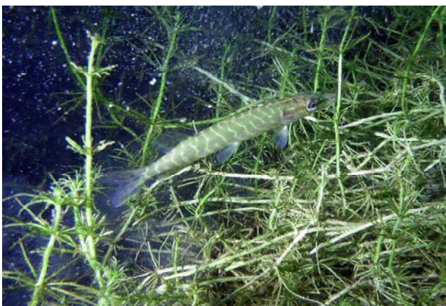
Pike - Brochet