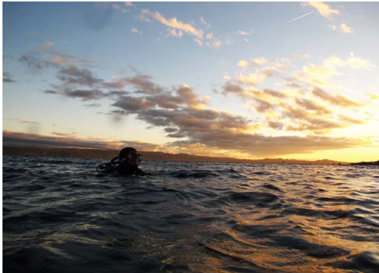
Lac de Neuchâtel - St-Aubin