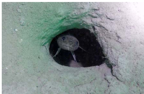
Lotte - Burbot

Imaginez-vous flottant devant une falaise vertigineuse, observant les recoins comme si vous flottiez devant un immeuble de 20 étages et que vous regardiez à l'intérieur les multiples décorations toujours originales. Parfois vous croiserez un habitant agitant son barbillon comme notre tigre des eaux douces, notre chère lotte, certainement nommée ainsi à cause de sa grande voracité et aux bigarrures de sa robe. Sa coloration peut varier mais celle de notre Riviera est d'un jaune olivâtre parsemée de marbrures irrégulières d'un brun-noir.