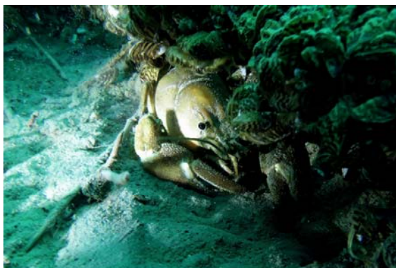
Crayfish - Ecrevisse