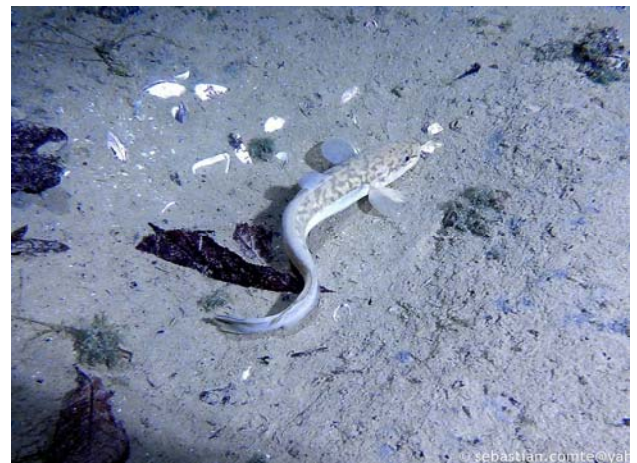
Lotte - Burbot