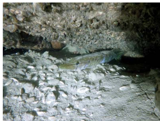
Pike - Brochet

Diving always begins by getting ready with our attire; it's time to forget all our little problems and focus on our equipment and our dive while defining our depth, our path and our dive time which we will share and discuss with our buddy. Once fitted, the hardest part is done, a small usual check and there we go to our world where the law of gravity is no longer the king but is replaced by our laws of Archimedes, Boyle, Dalton or Henry. Perhaps today our planet will be St-Aubin in Lake Neuchatel with its impressive gravel pyramids, so strange and colourful. This dive will end on a beautiful meadow where we seek our lion, the pike, king of our waters with its broad snout rounded forward with a certain similarity with a spatula or even better with the beak of some ducks.