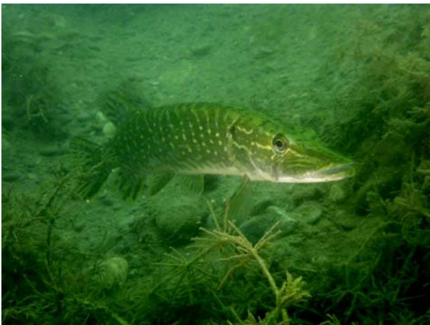
Brochet - Pike