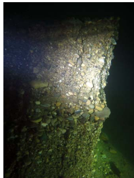
St-Aubin, Pyramide de Gravier

Une plongée commence toujours en s'équipant; c'est le moment d'oublier tous nos petits soucis et de nous recentrer, nous concentrer sur notre matériel et sur notre plongée tout en définissant notre profondeur, notre trajet et notre temps de plongée que nous partagerons et discuterons ensuite avec notre binôme. Une fois équipés, le plus difficile est fait, un petit «check» d'usage et nous partons vers un monde où la loi de la gravité n'est plus la reine mais elle est remplacée par nos lois à nous, celles d'Archimède, de Boyle-Mariotte, Dalton ou Henri. Notre planète aujourd'hui sera peut-être le village de St-Aubin dans le lac de Neuchâtel avec ses pyramides de gravier impressionnantes, si étranges et colorées. La plongée finira sur un très bel herbier où nous rechercherons notre lion à nous, notre brochet, roi de nos eaux avec son large museau, arrondi en avant ayant une certaine ressemblance avec une spatule ou mieux encore avec le bec de certains canards.