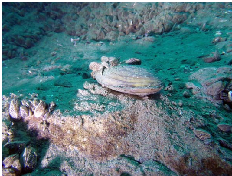
Anodonta Lake Mussel - Moule d'eau douce