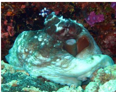
Le poulpe, roi du camouflage