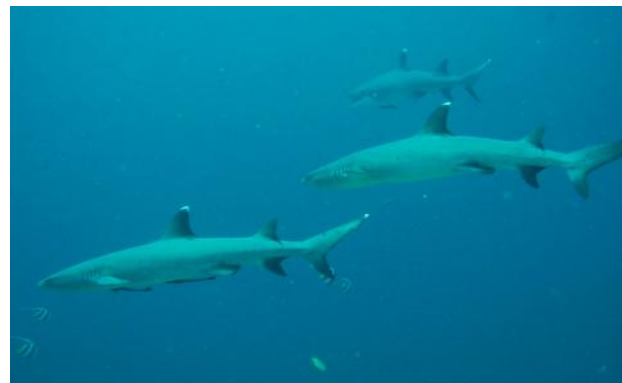
Sans oublier les seigneurs des mers...