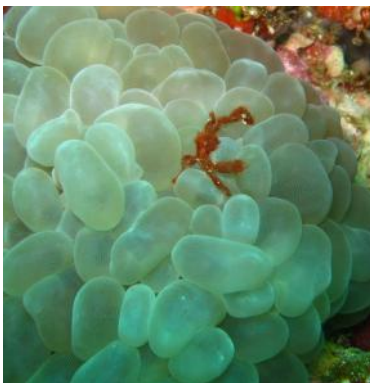
Araignée sur corail bulle