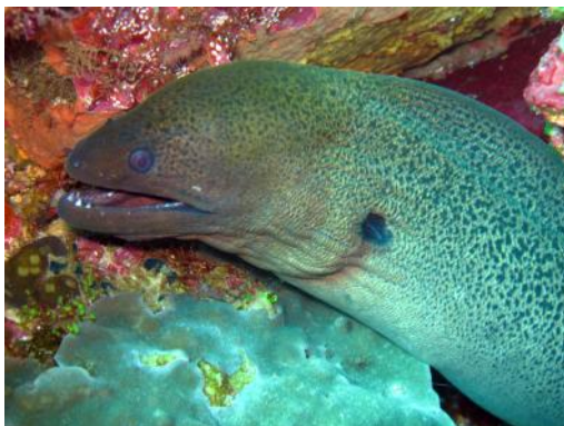
La murène était au rendez-vous