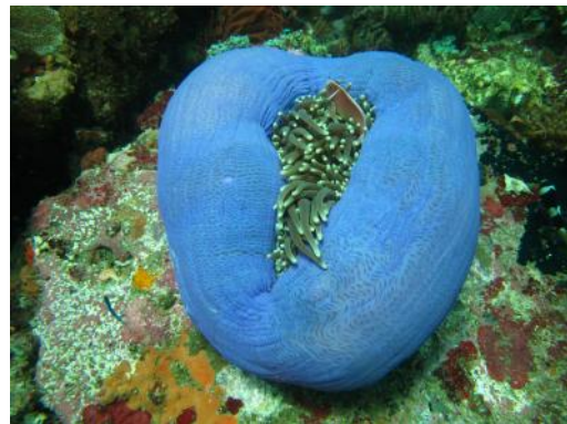
Tout comme le poisson clown