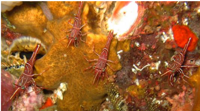
Crevettes de Durban